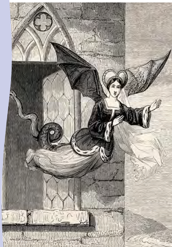
Gravure de la fée Mélusine dans Le Roman de Mélusine de 1387.